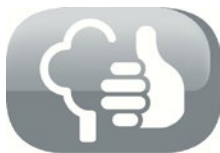
Respetuoso del medio ambiente