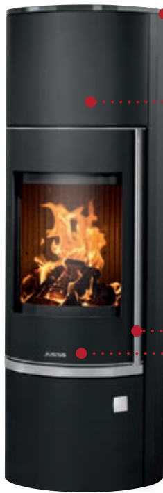
Faro W+ 2.0 Stahl Schwarz mit Abdeckplatte Glas