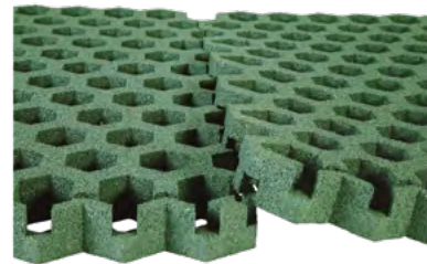
Die Verbindung der Rasengitterplatte Hexagon