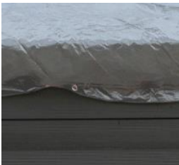
Winterabdeckung Winter cover CIKPCOR46