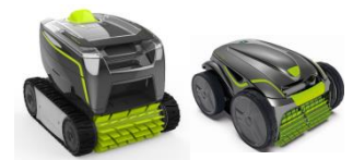
Roboter Robot GT3220/GV3420