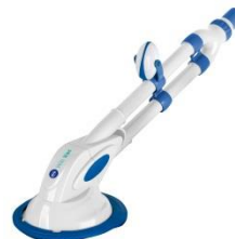
Automatischer Bodenreiniger Automatic cleaner 90399