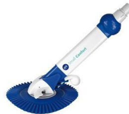
Automatischer Bodenreiniger Automatic cleaner AR20682