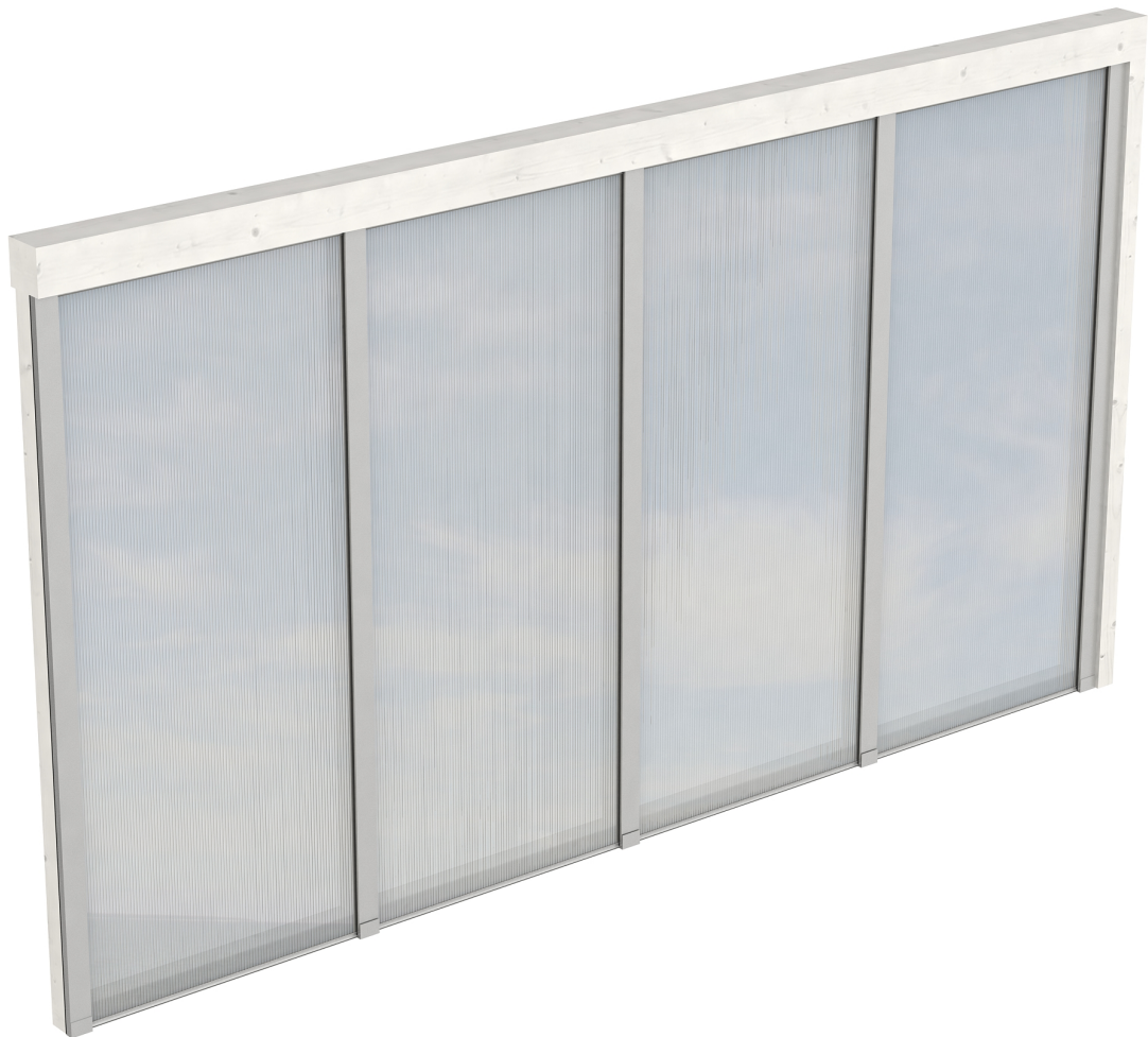
Produktbild Polycarbonat-Seitenwand 355cm