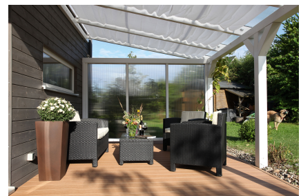
Kundenfoto: Terrassenüberdachung weiss mit Seitenwand Polycarbonat