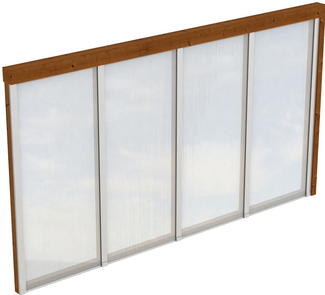
Produktbild Polycarbonat-Seitenwand 355cm