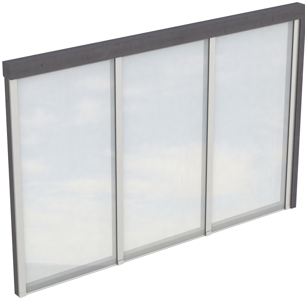
Produktbild Polycarbonat-Seitenwand 305cm