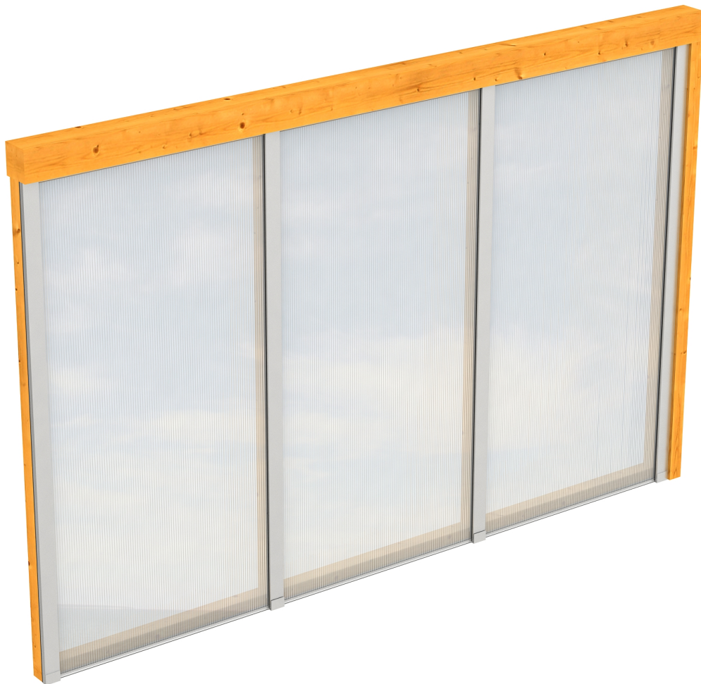
Produktbild Polycarbonat-Seitenwand 305cm