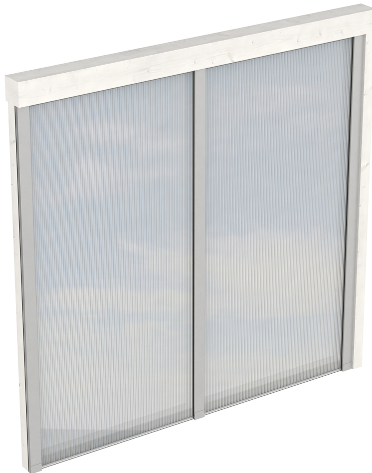
Produktbild Polycarbonat-Seitenwand 205cm