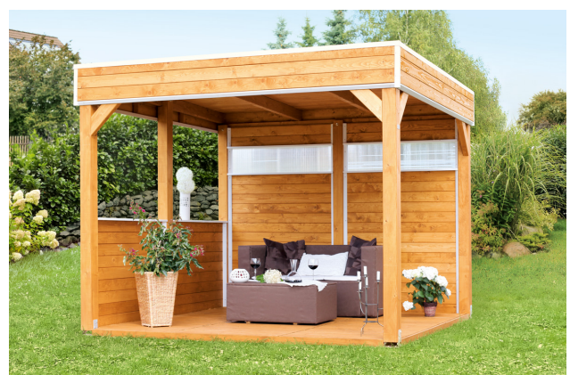
Kundenfoto: Pavillon mit Zubehör