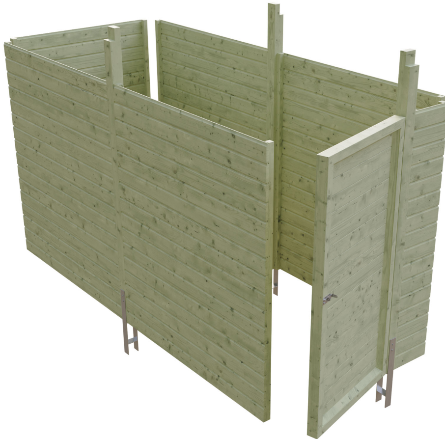
Produktbild Abstellraum C1