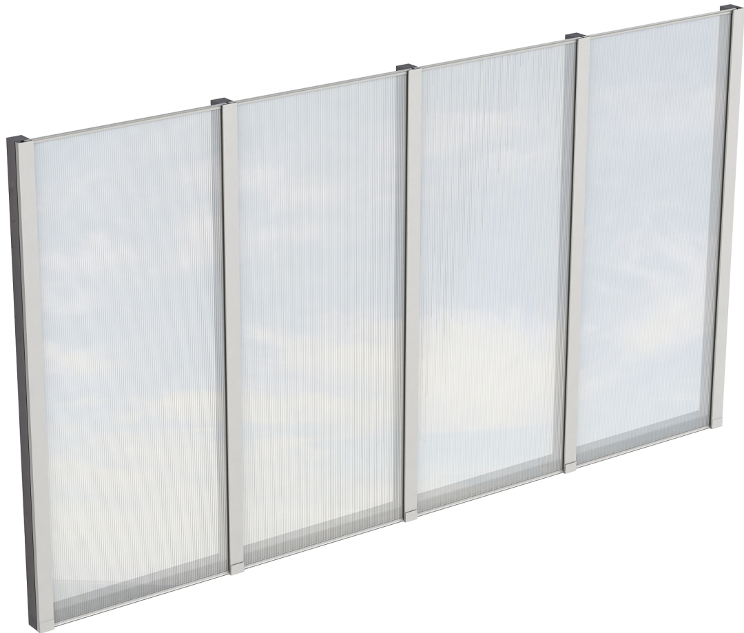
Produktbild Polycarbonat-Seitenwand 355cm