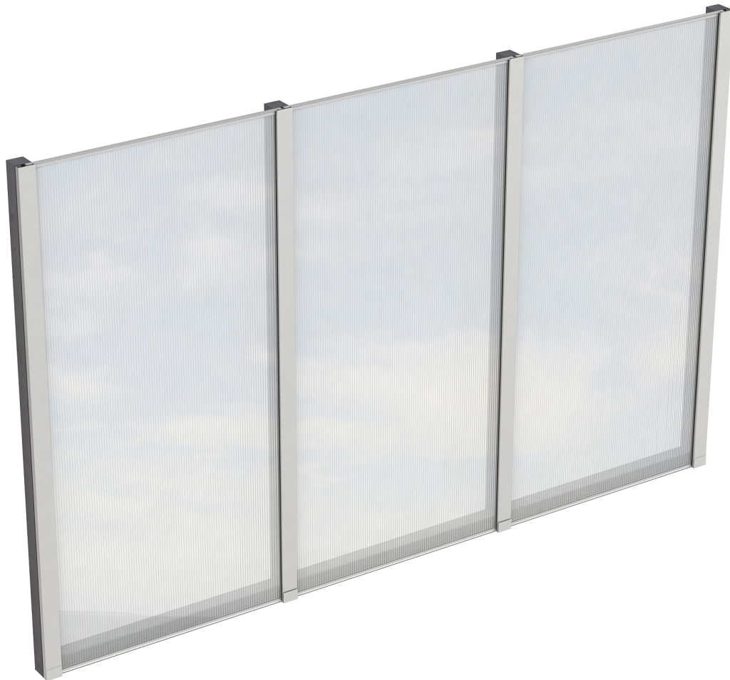
Produktbild Polycarbonat-Seitenwand 305cm