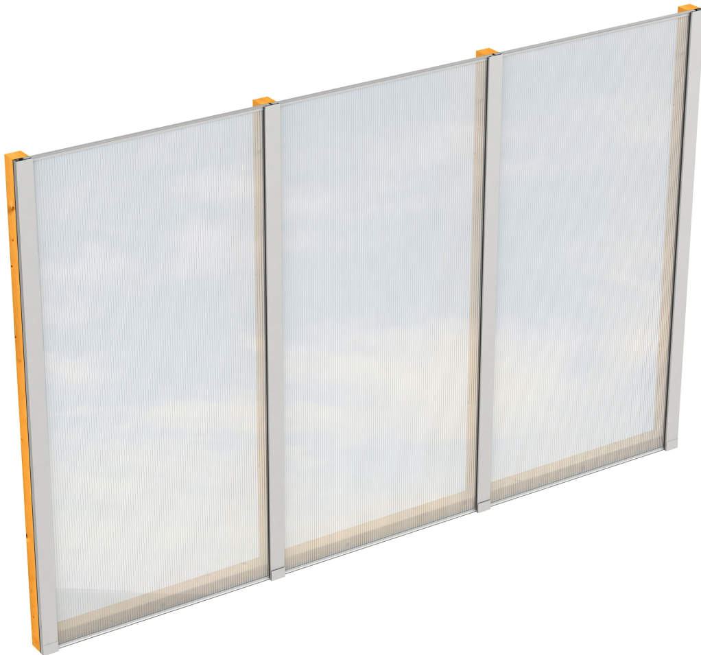
Produktbild Polycarbonat-Seitenwand 305cm