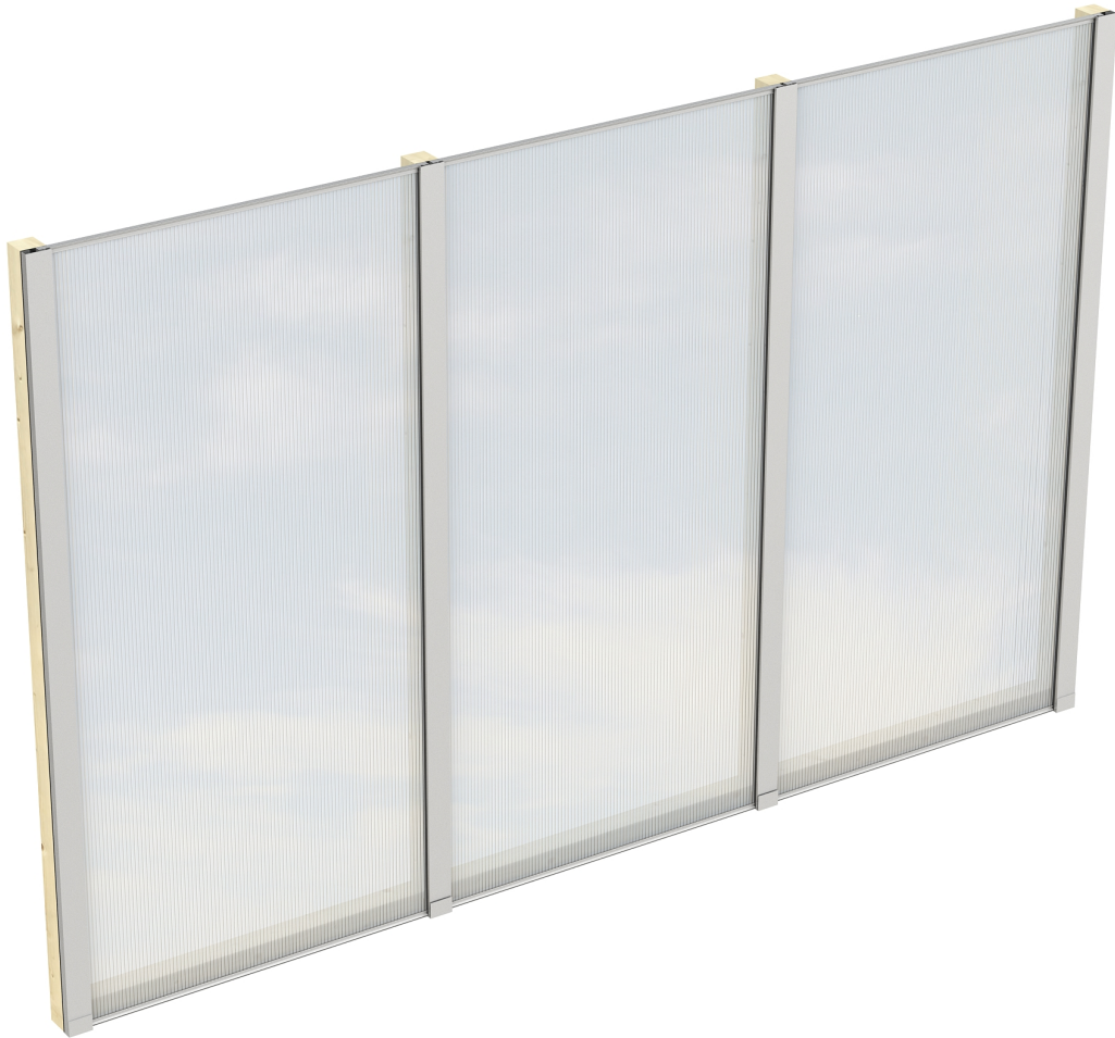
Produktbild Polycarbonat-Seitenwand 305cm