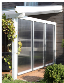
Kundenfoto: Terrassenüberdachung weiss mit Seitenwand Polycarbonat