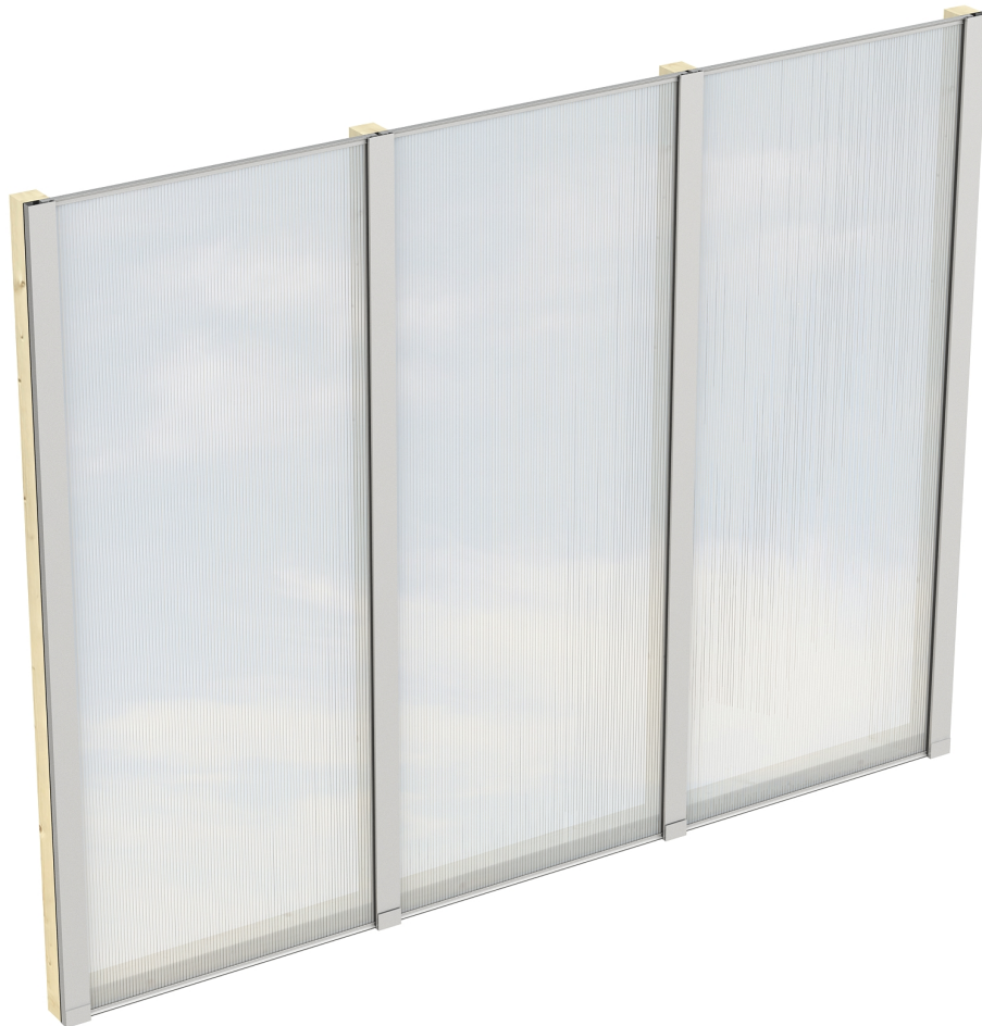
Produktbild Polycarbonat-Seitenwand 255cm