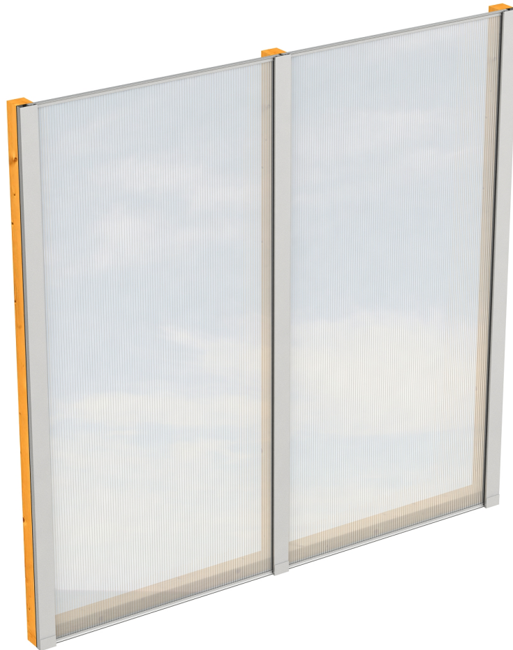
Produktbild Polycarbonat-Seitenwand 205cm