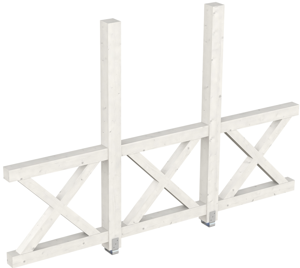
Produktbild AK-Seitenwand 305cm