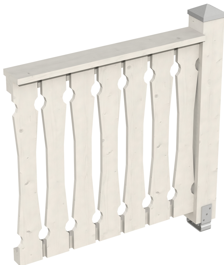
Produktbild Brüstung 108 cm