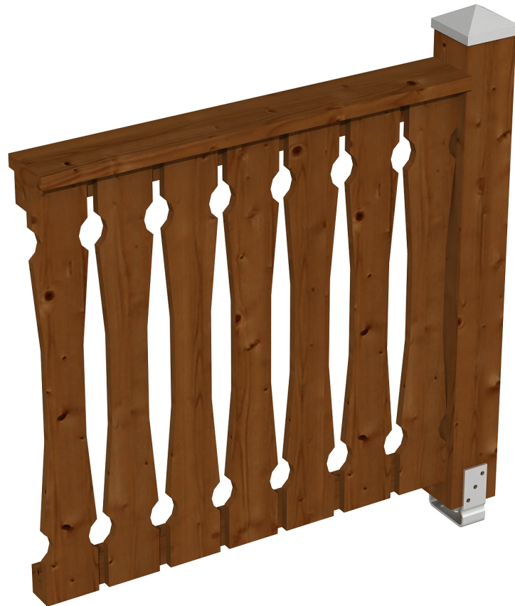
Produktbild Brüstung 108 cm