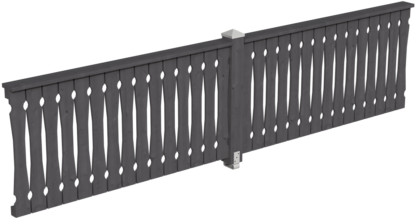
Produktbild Brüstung 400 cm