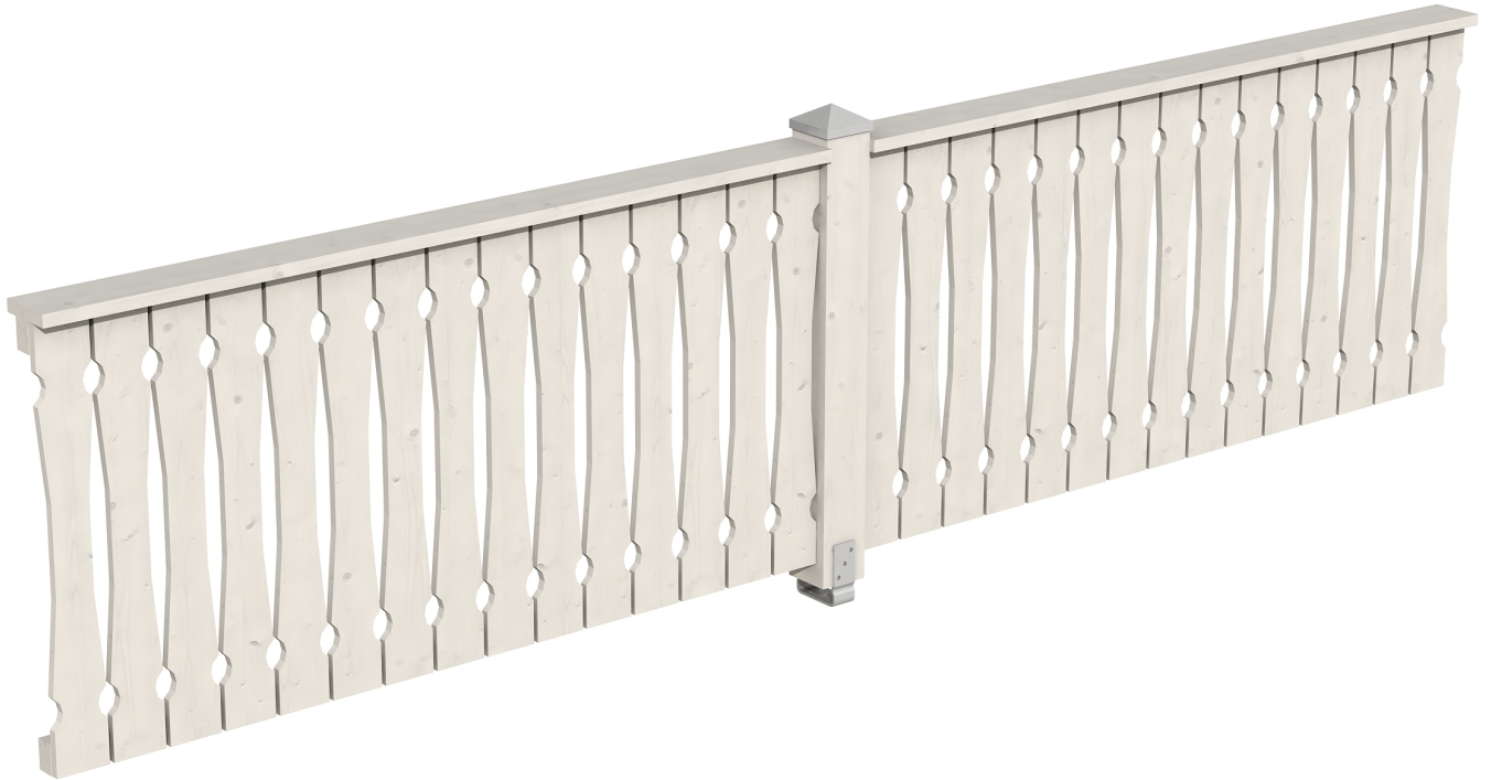
Produktbild Brüstung 400 cm