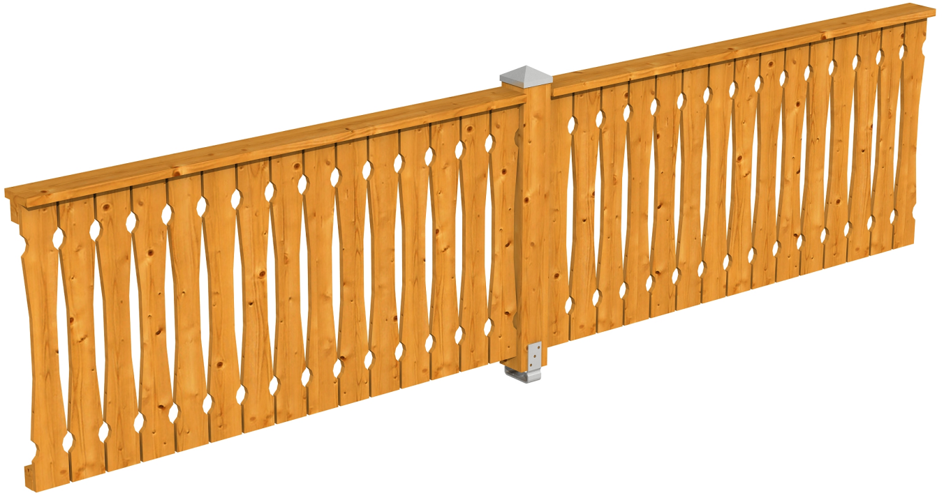
Produktbild Brüstung 400 cm