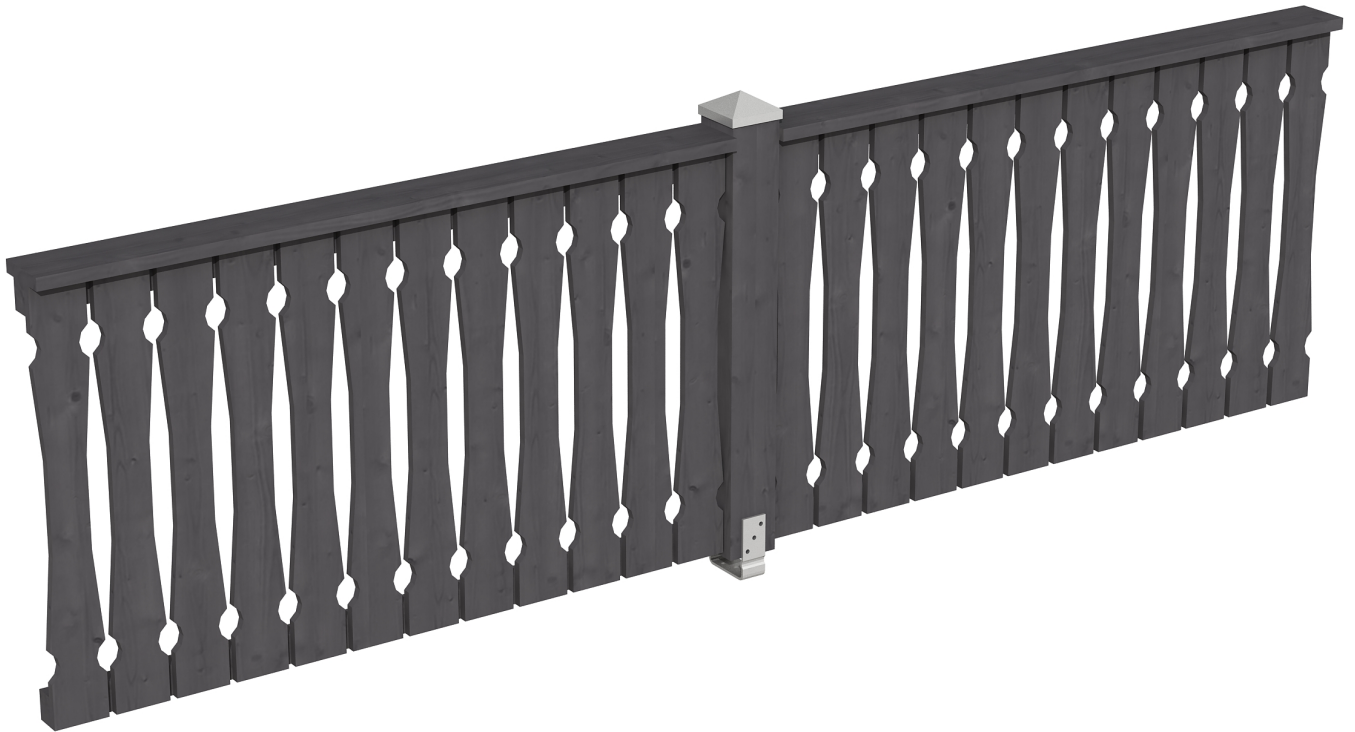
Produktbild Brüstung 335 cm