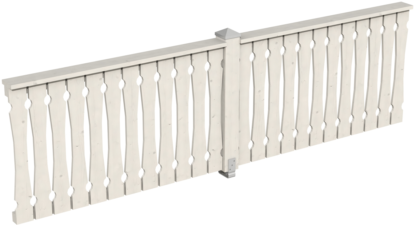
Produktbild Brüstung 335 cm