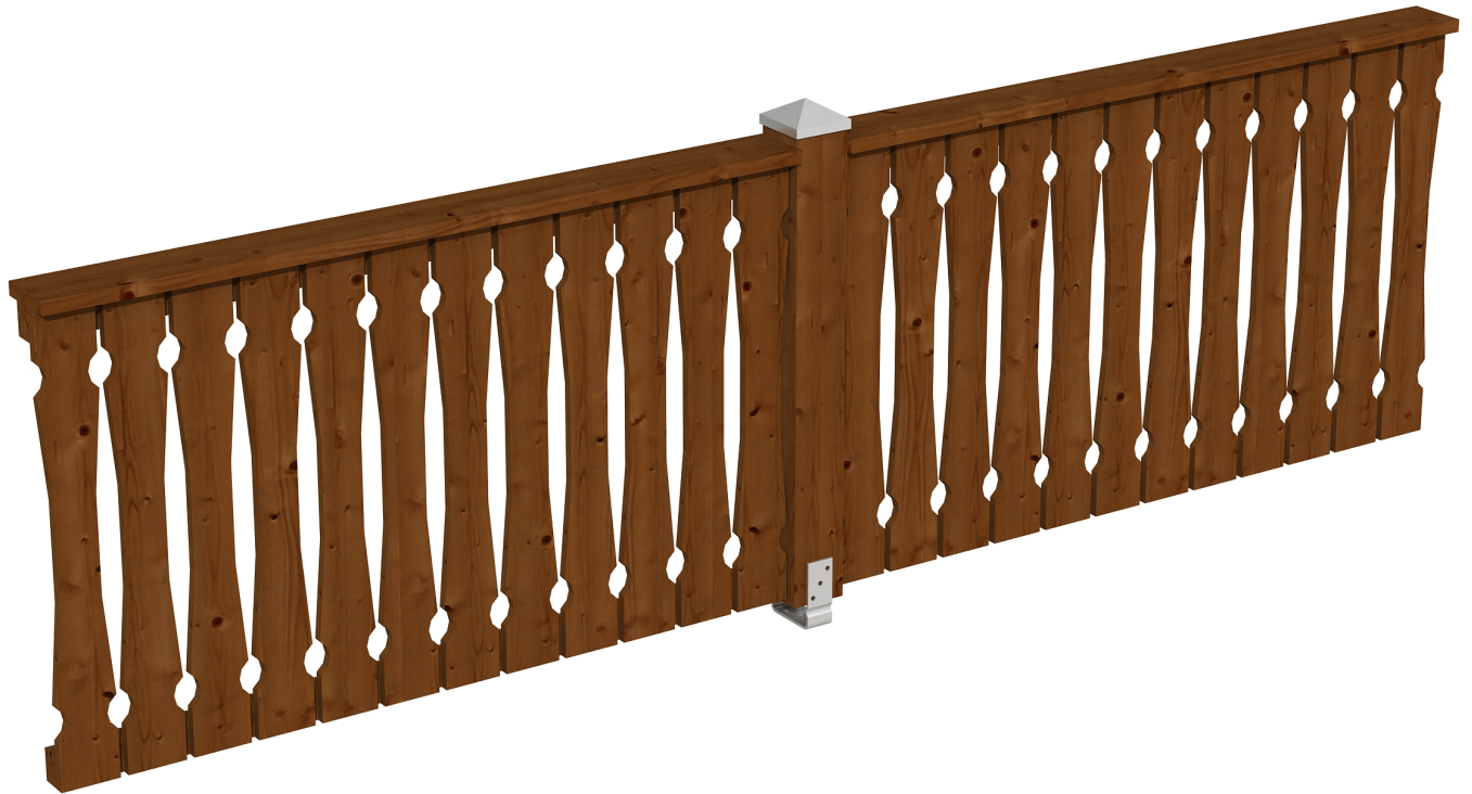
Produktbild Brüstung 335 cm