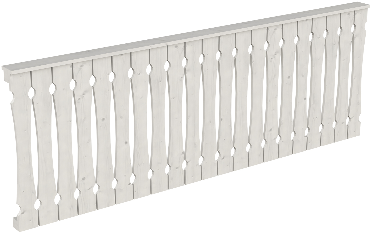
Produktbild AK-Brüstung 270cm