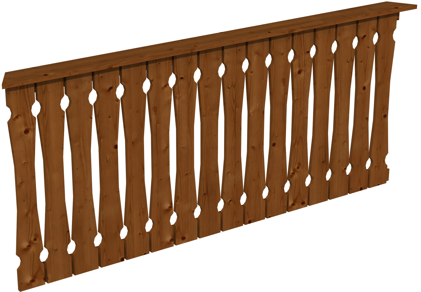
Produktbild Brüstung 210 cm