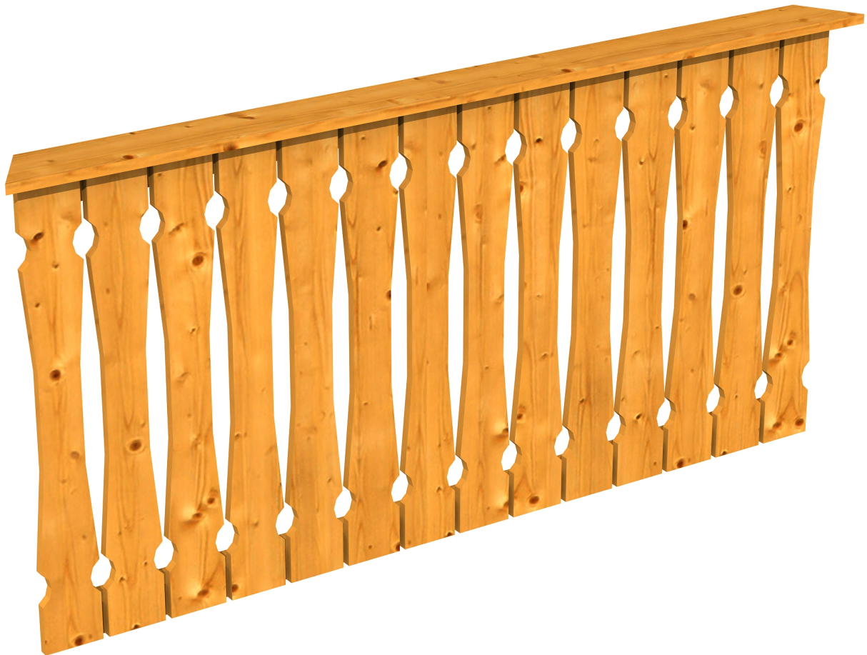
Produktbild Brüstung 180 cm