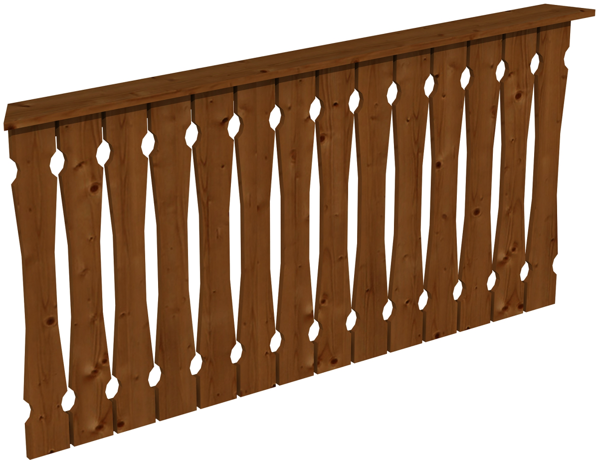
Produktbild Brüstung 180 cm