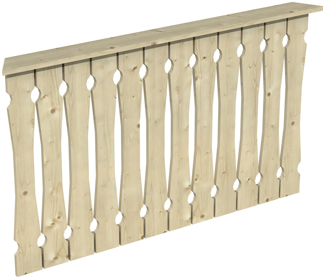
Produktbild Brüstung 150 cm