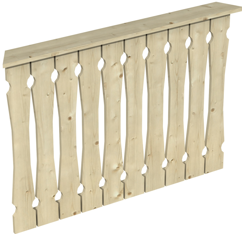
Produktbild Brüstung 120 cm