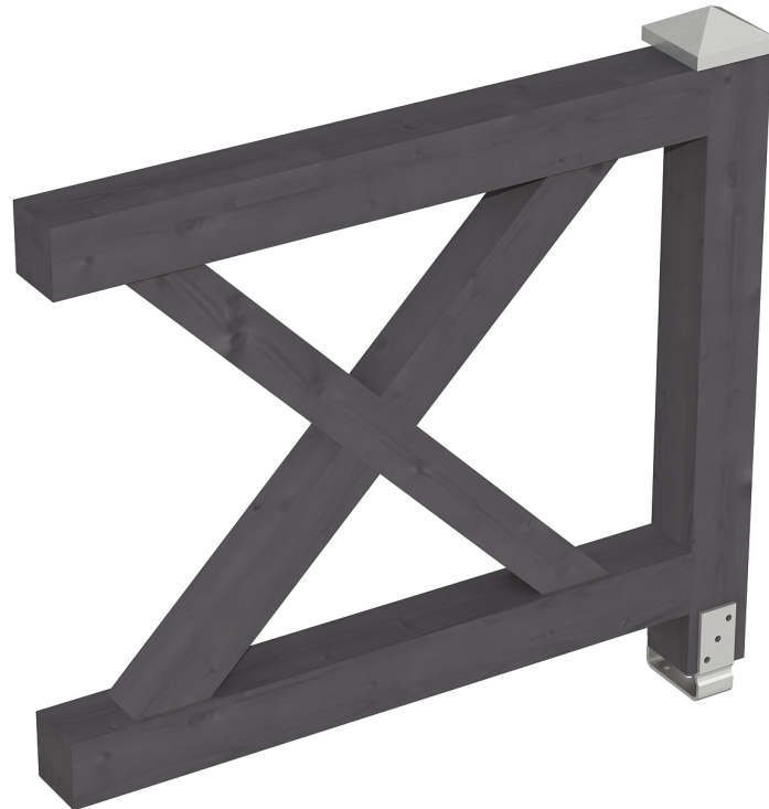
Produktbild AK-Brüstung 108cm