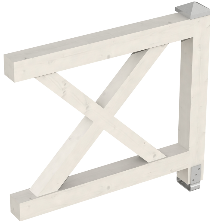
Produktbild AK-Brüstung 108cm