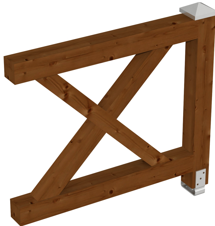
Produktbild AK-Brüstung 108cm