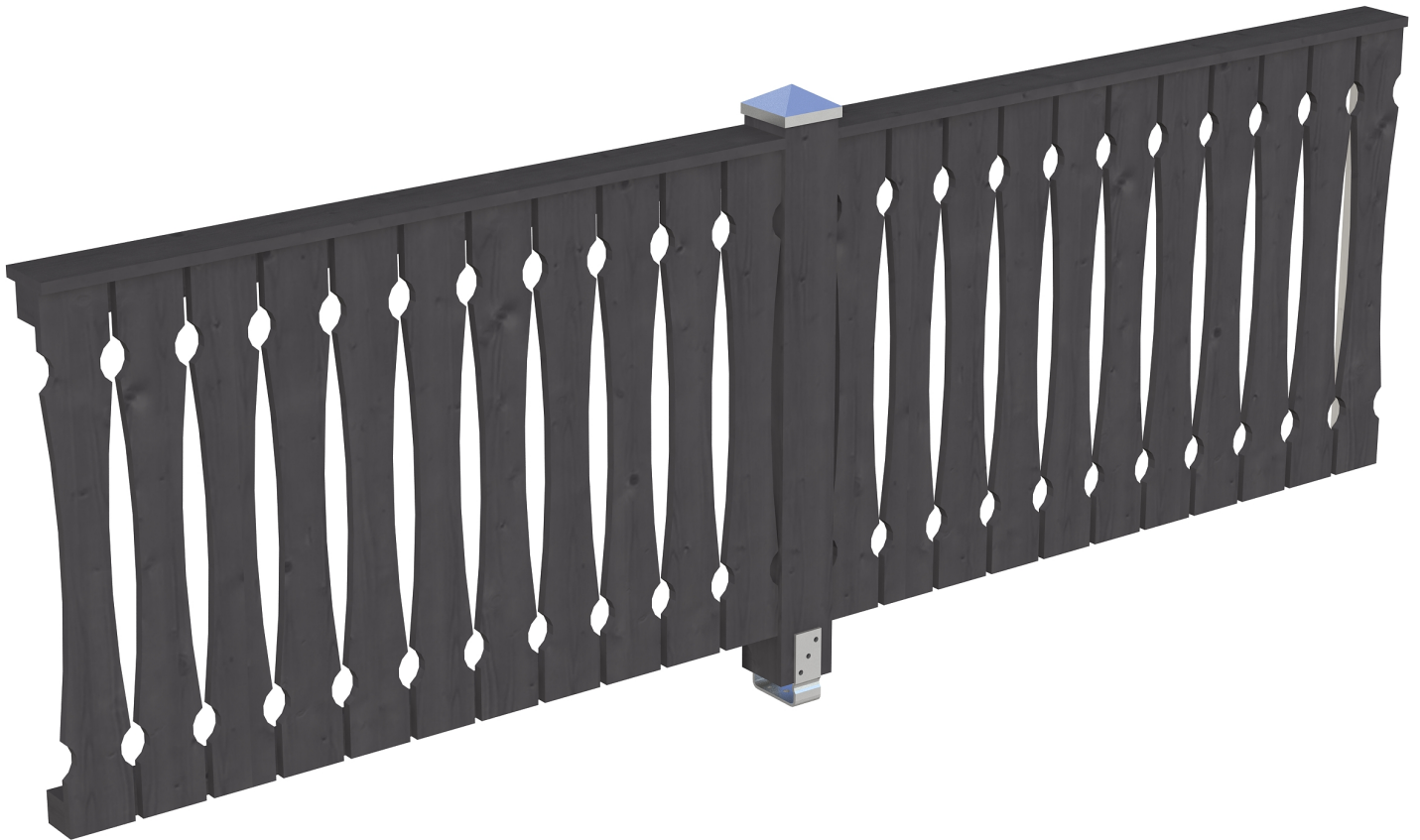
Produktbild AK-Seitenwand 305cm