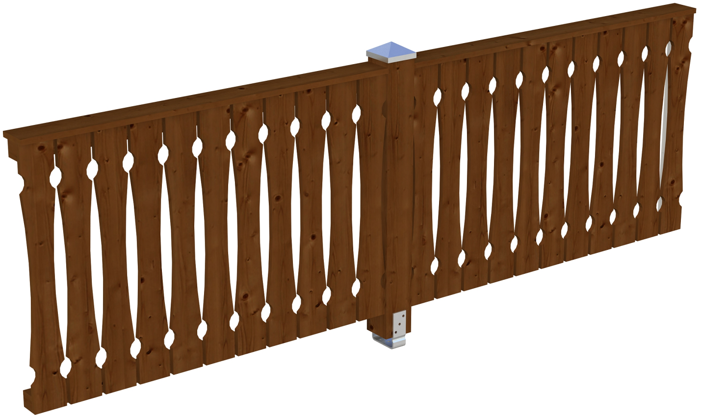
Produktbild AK-Seitenwand 305cm