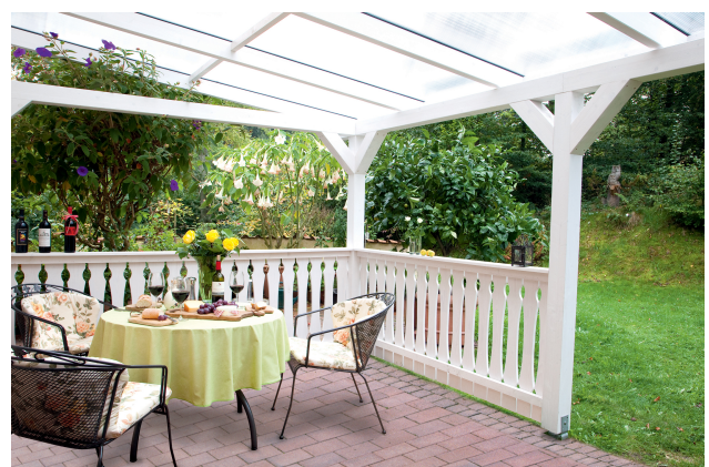
Kundenfoto: Terrassenüberdachung in weiss mit Brüstungen