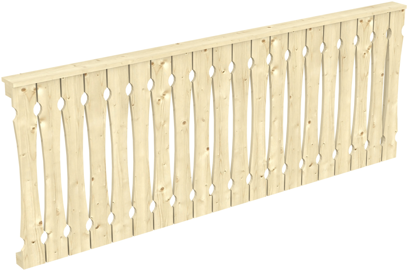
Produktbild AK-Seitenwand 255cm