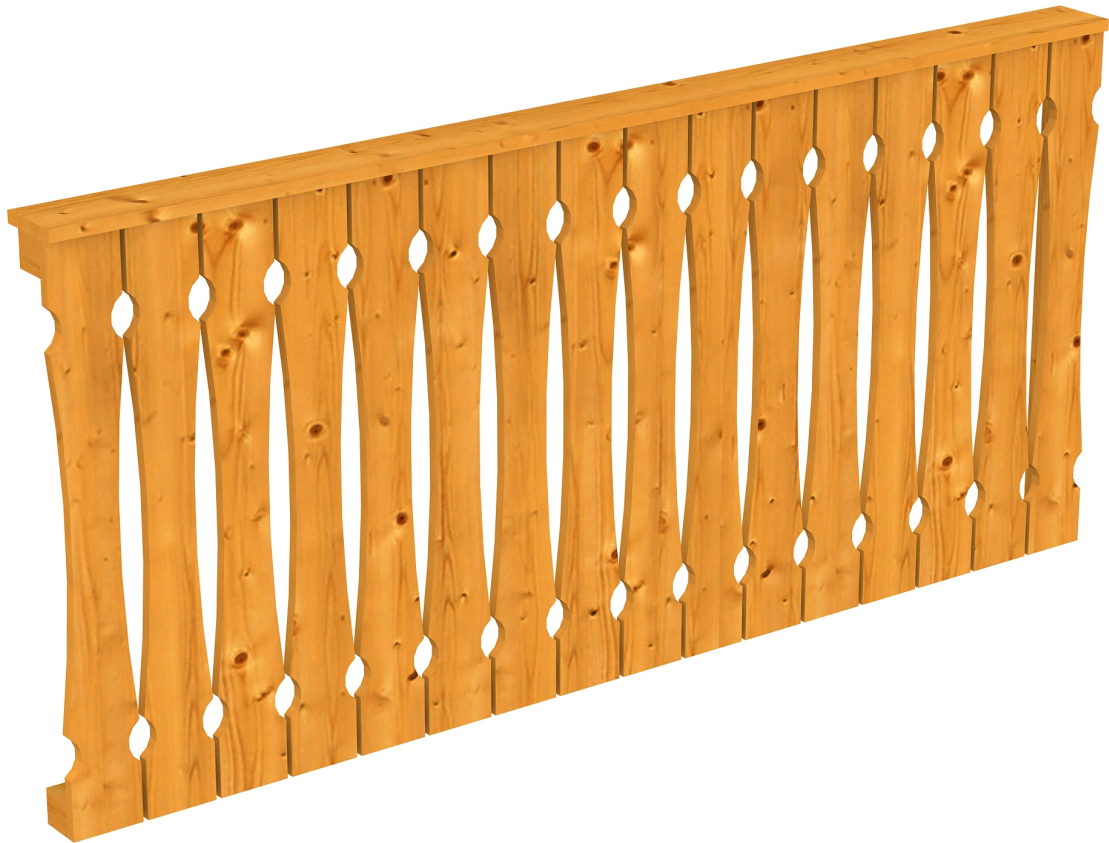
Produktbild AK-Seitenwand 205cm