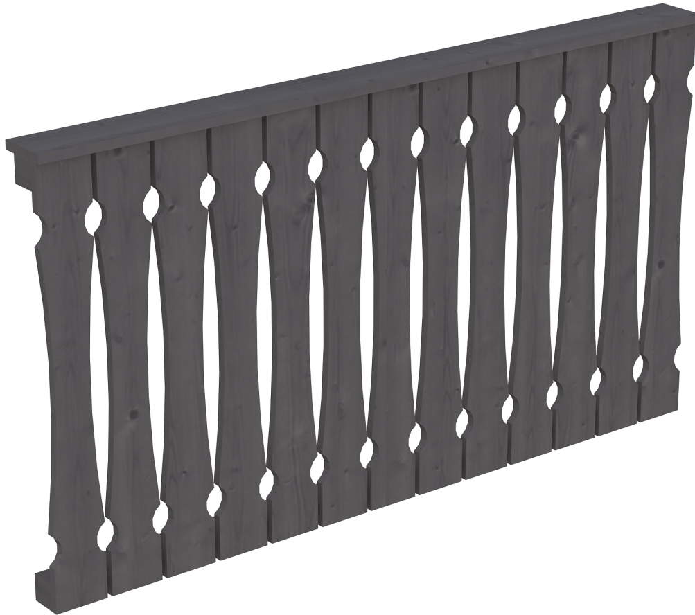
Produktbild AK-Brüstung 170cm