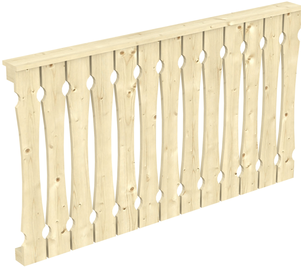
Produktbild AK-Brüstung 170cm