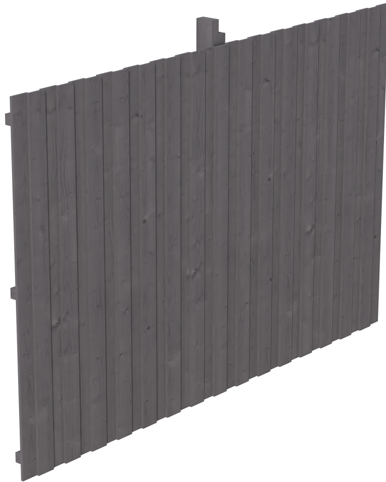
Produktbild Rückwand Deckelschalung