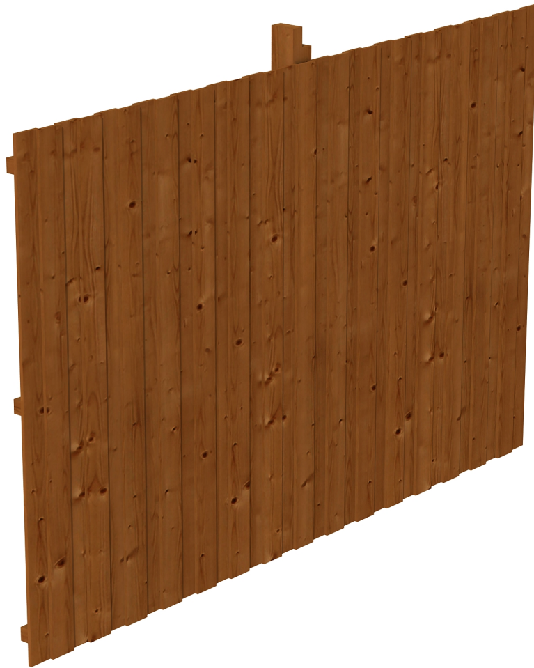
Produktbild Rückwand Deckelschalung