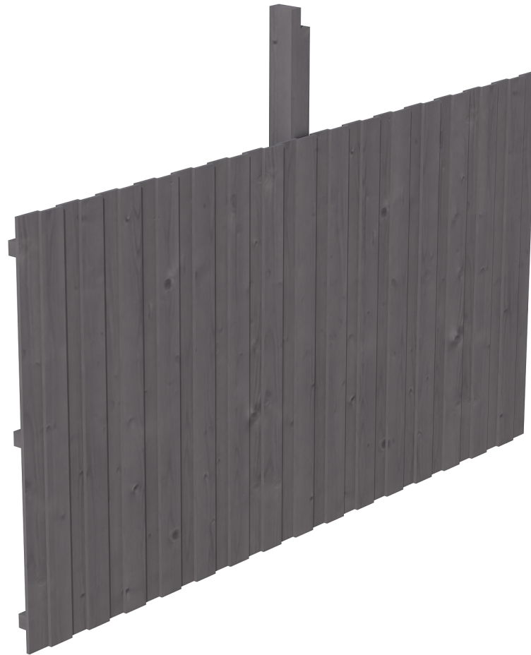
Produktbild Rückwand Deckelschalung