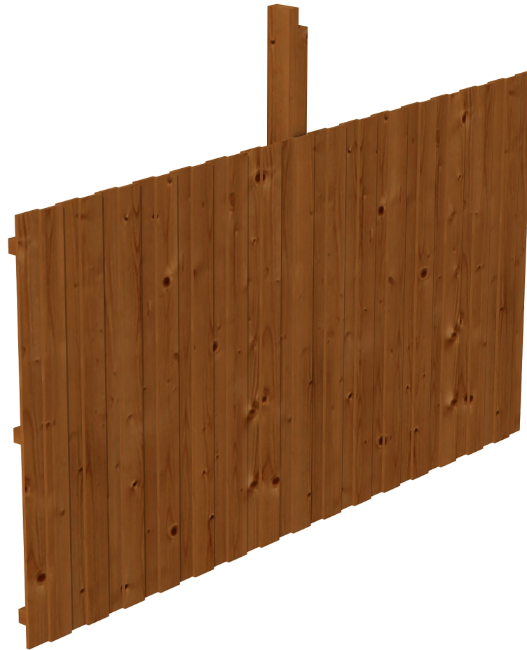
Produktbild Rückwand Deckelschalung