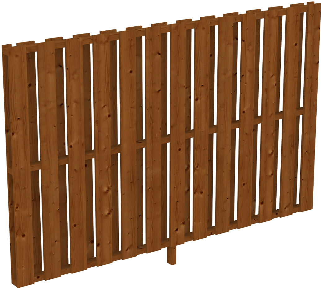
Produktbild Seitenwand Deckelschalung 255cm