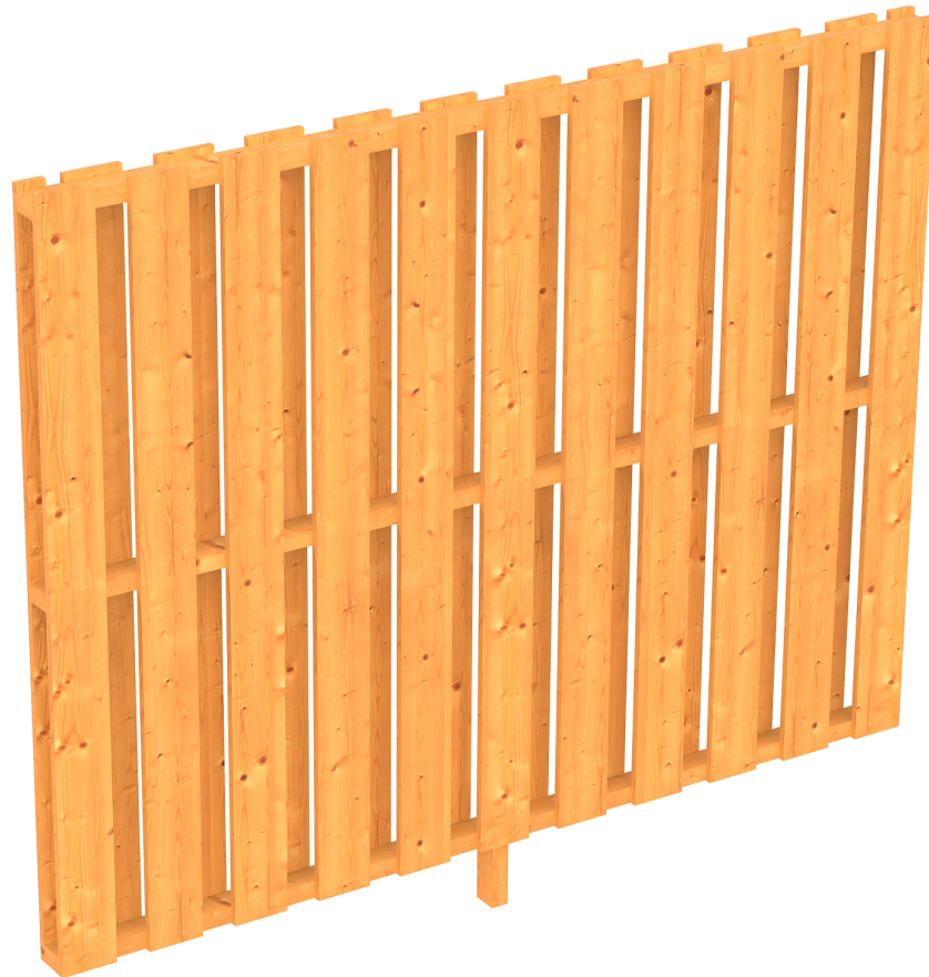
Produktbild Seitenwand Deckelschalung 205cm