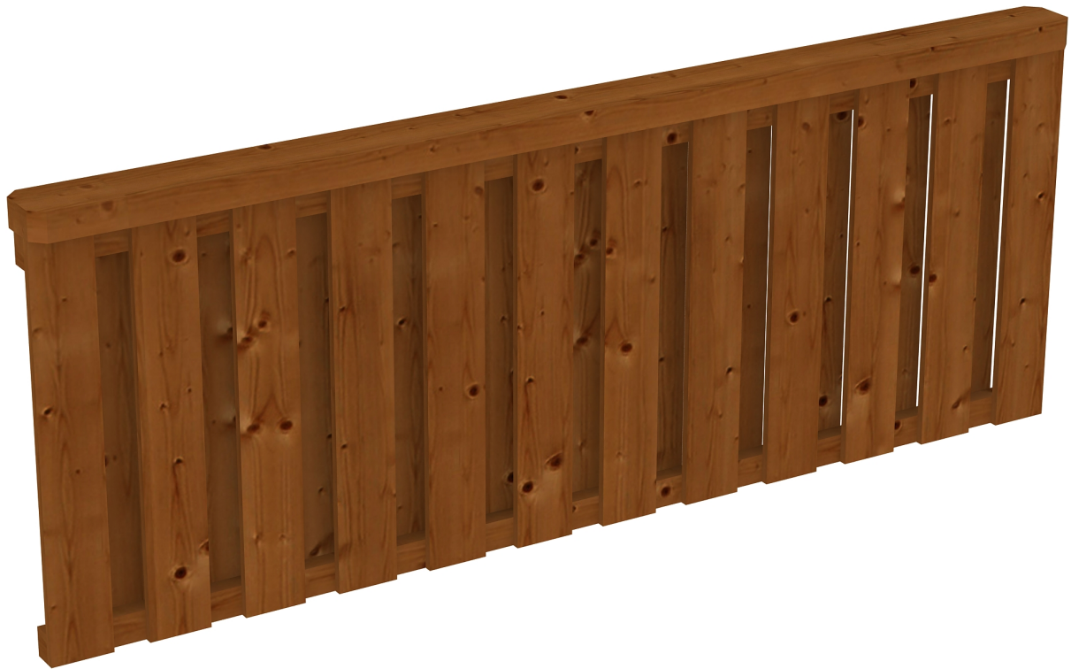
Produktbild Brüstung Deckelschlung 220cm