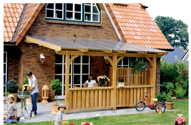
Kundenfoto: Terrassenüberdachung mit Brüstungen und Seitenwand